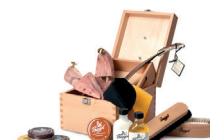
Zestaw do czyszczenia butów