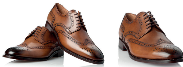
Brązowe angielski - pełne brogry