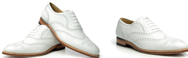
Białe wiedenki ze skóry jelenia