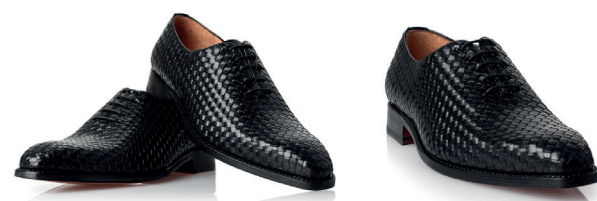
Czarne plecione wiedenki