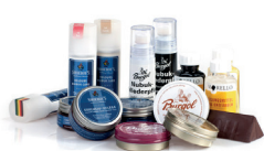
Pasta do butów