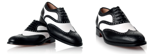
Dwukolorowe buty Spectator