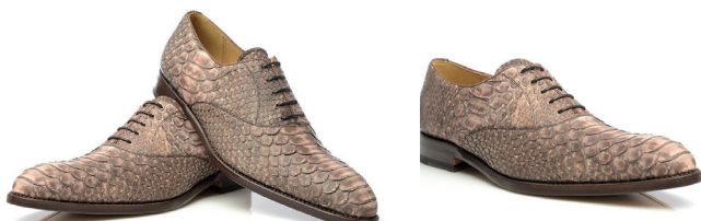
Brązowe wiedenki ze skóry pytona