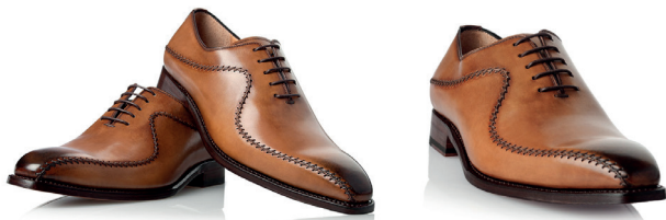
Brązowe wiedenki ze szwem