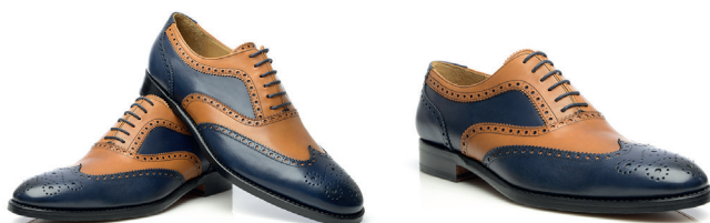
Buty Oxford w dwóch kolorach