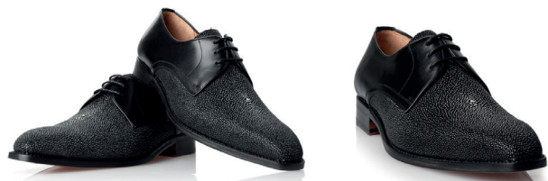
Czarne angiellki ze skóry płaszczy