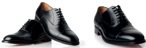
Czarne wiedeńki z nakładanym noskiem