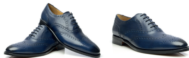
Granatowe wiedeńki - pełne brogry