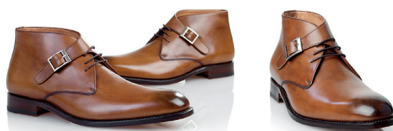
Brązowe George Boot