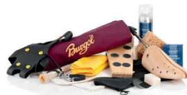
Aksesoria do butów