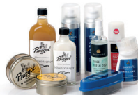
Produkty do pielęgnacji obuwia