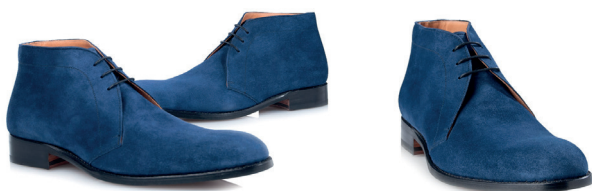
Granatowe buty chukka z nubuku