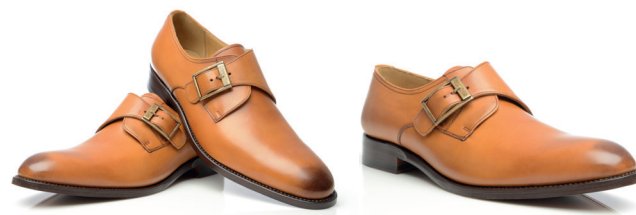
Podwójne monki w koniakowym kolorze