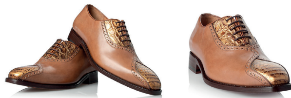
Oxford ze skóry krokodyla